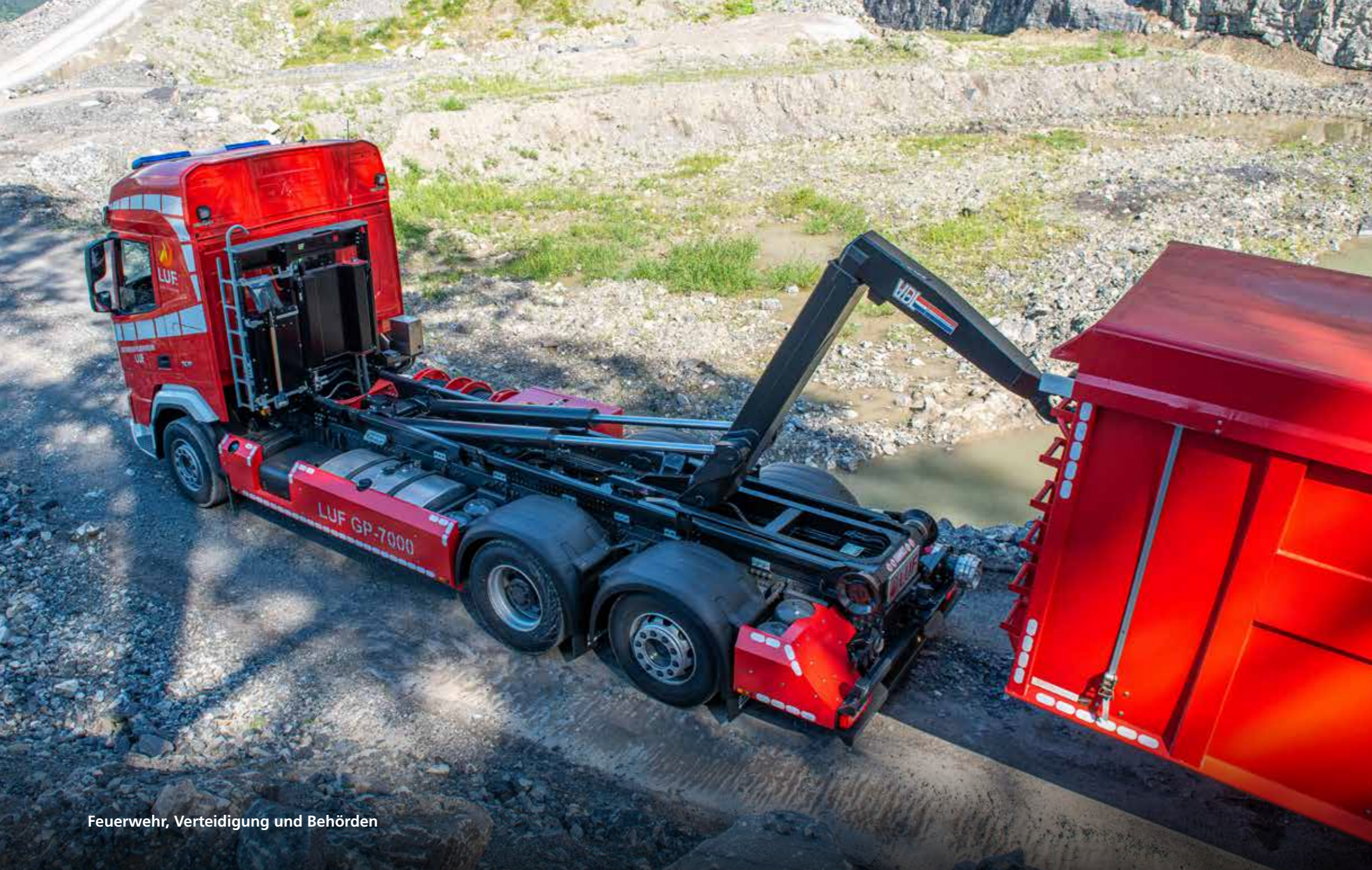
Feuerwehr, Verteidigung und Behörden

wichtige Meldungen an Ihren Lkw. Dadurch werden ungeplante Ausfallzeiten vermieden und Ihr System bleibt maximal einsatzfähig.