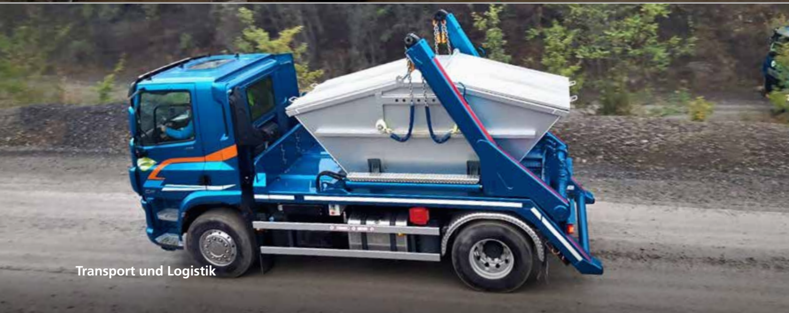
Transport und Logistik