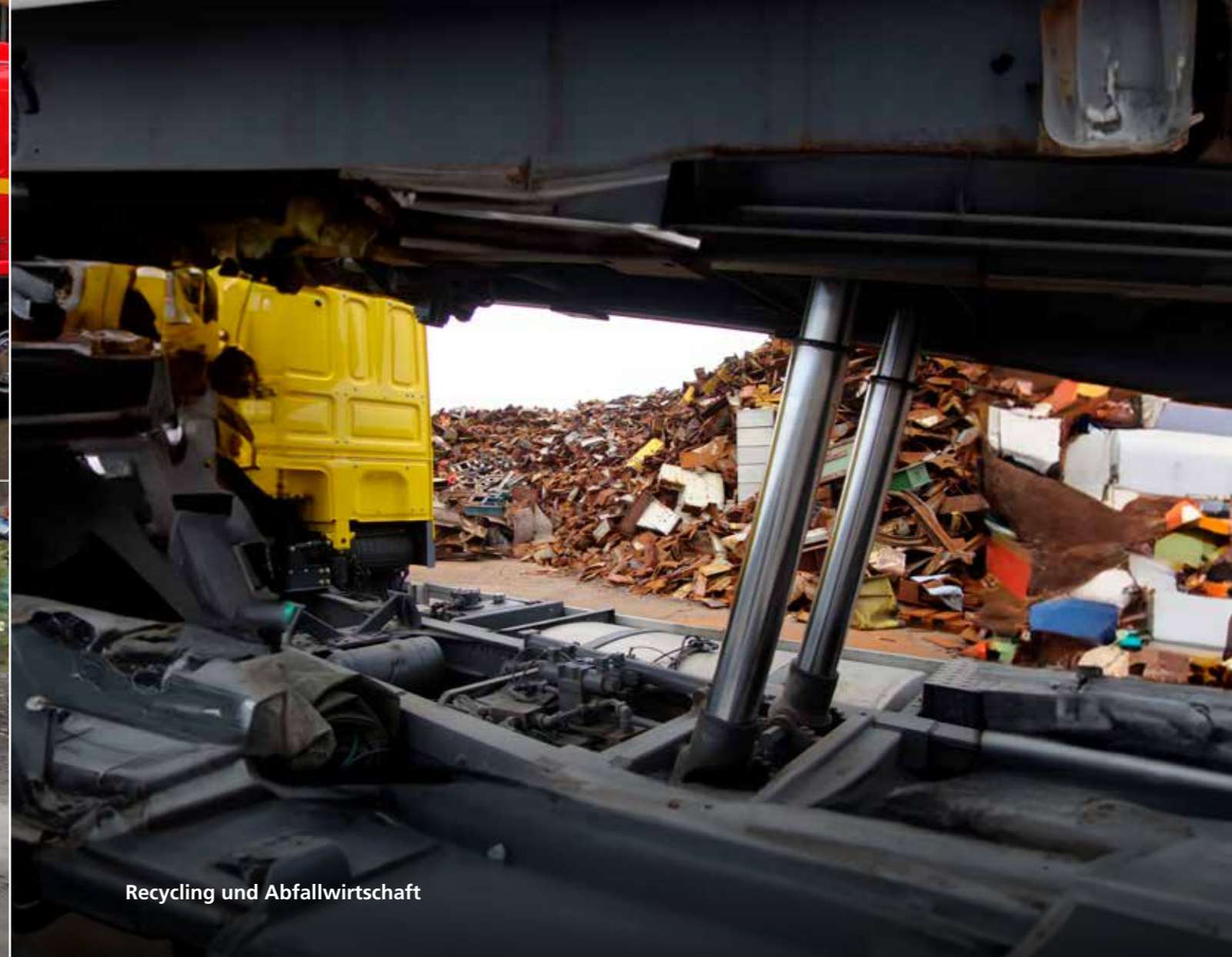
Recycling und Abfallwirtschaft