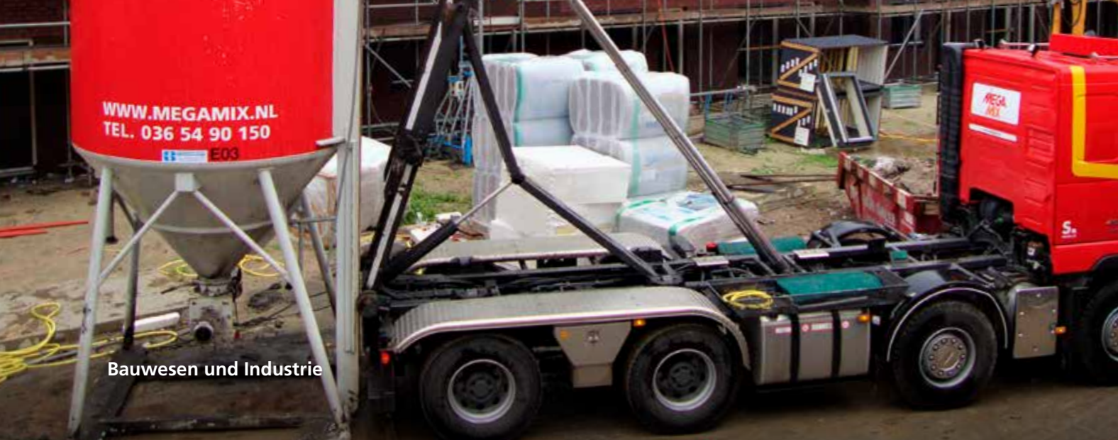
Bauwesen und Industrie